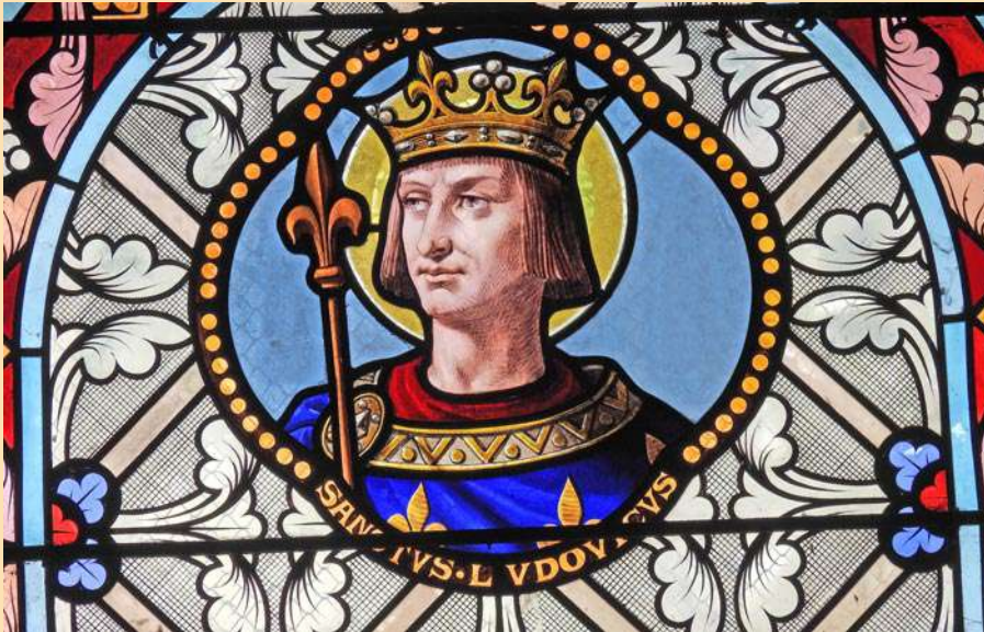
...de saint Louis