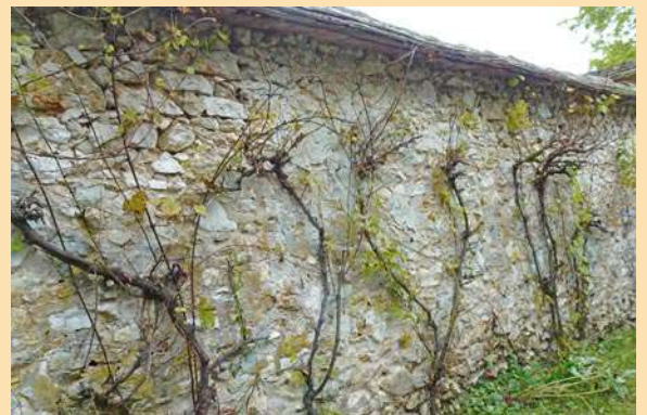
Mur à chasselas