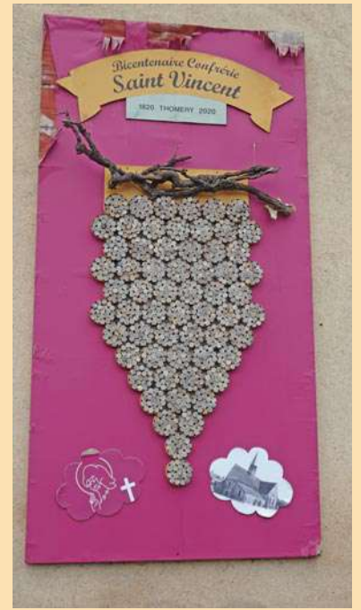
Sous la marque de saint Vincent...