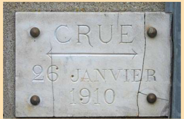
La crue de 1910