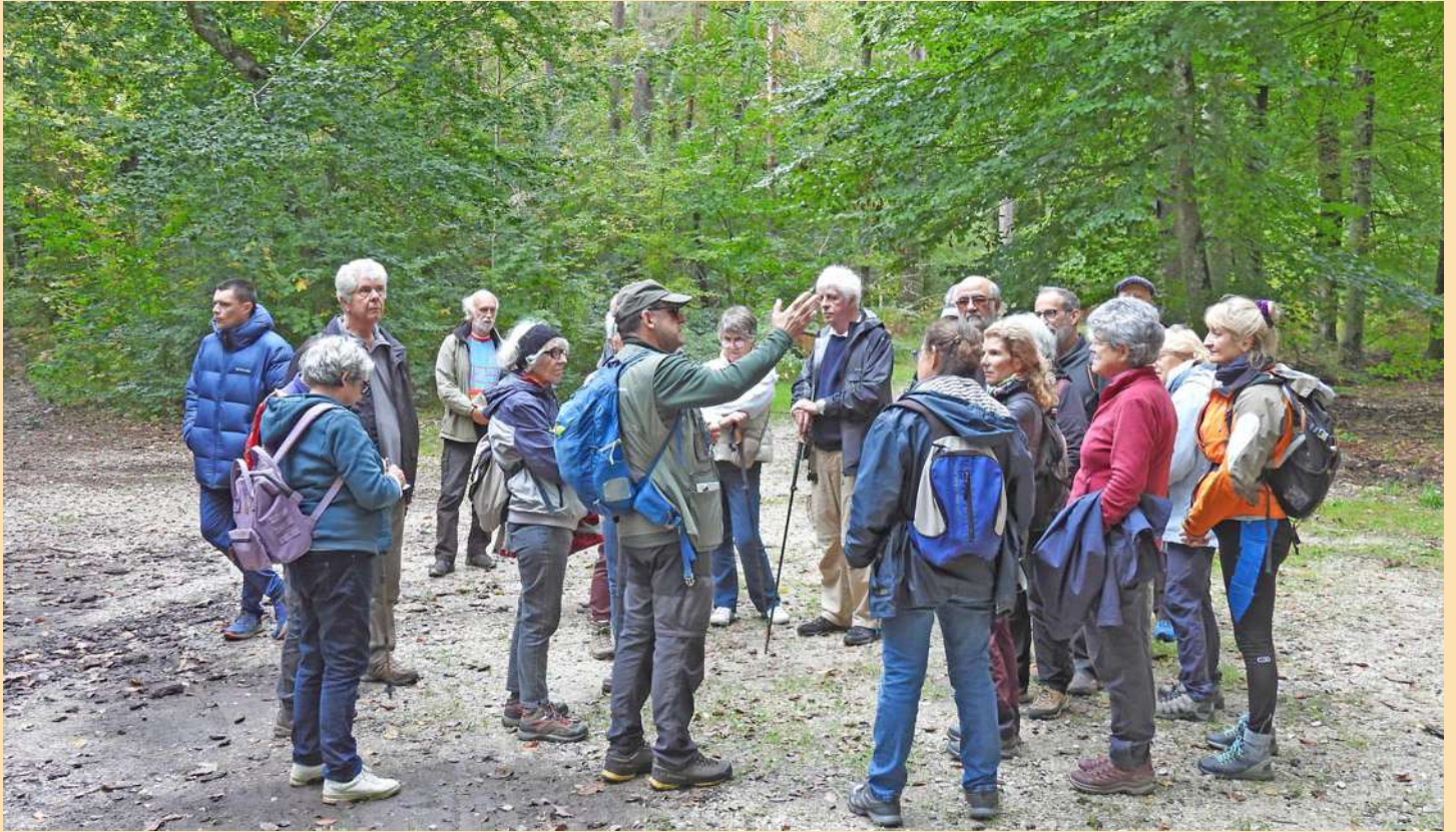
Tout le monde, enfin presque, écoute le commentaire...