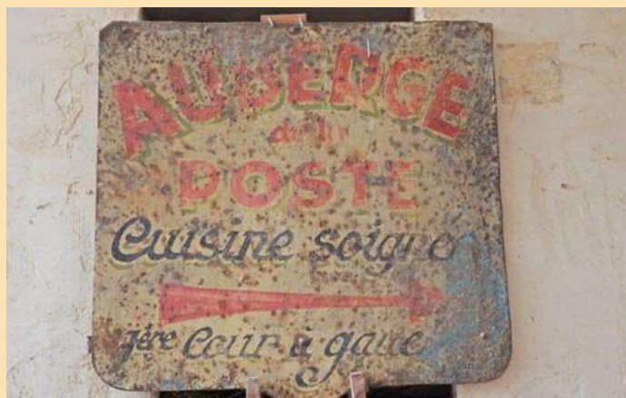
De la bonne cuisine vers...