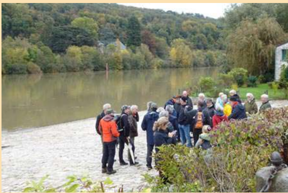
Le port d'Effondré

Il s'agissait de la désormais traditionnelle sortie annuelle entre les Amis du patrimoine des environs de La Chapelle-la-Reine et les Amis de la forêt de Fontainebleau (AFF). Le matin nous nous sommes promenés dans le village , sous la conduite d'un des guides officiels de l'Office de tourisme de Thomery, par ailleurs membre du conseil d'administration des Amis du patrimoine de La Chapelle-la-Reine.