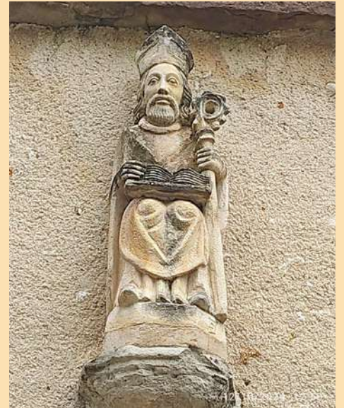
...et de saint Amand