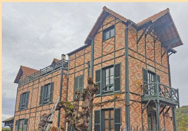
Soyons curieux de tout!