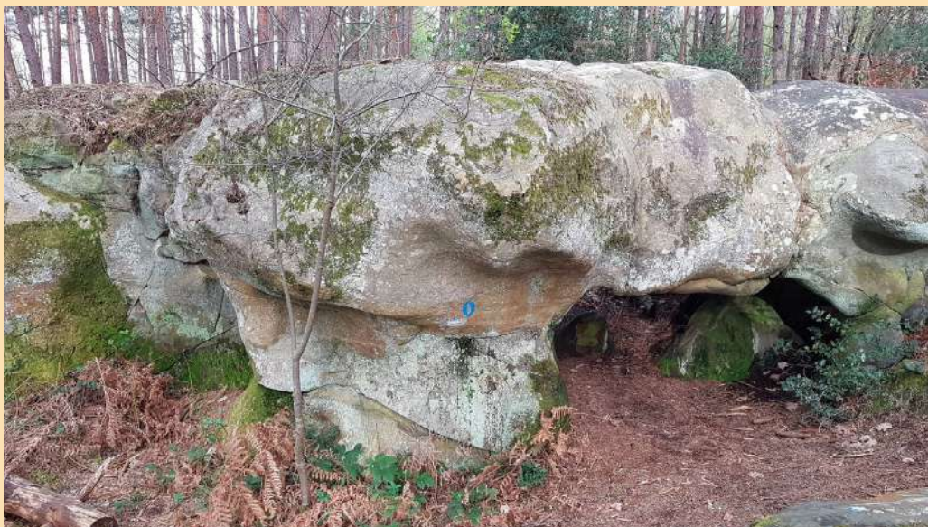
Petit temple de Cythère