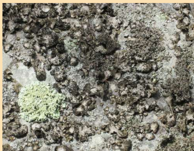
Un autre lichen qui aime le vent et le soleil ( Lasallia pustulata )