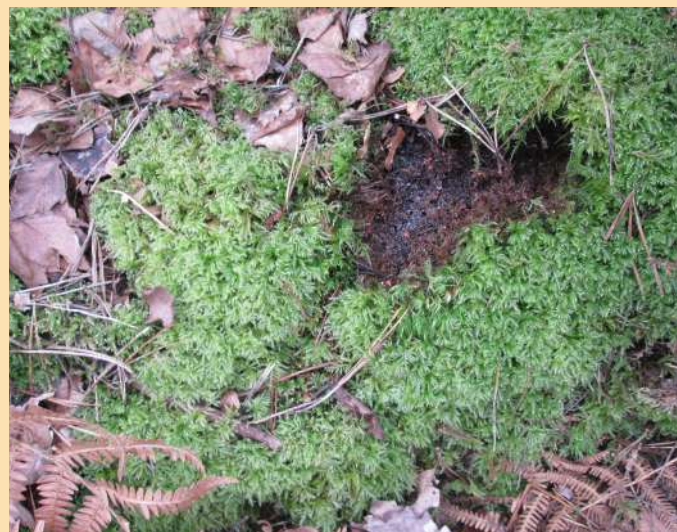
Une mousse « moquette » ( Isoetecium myosuroides )