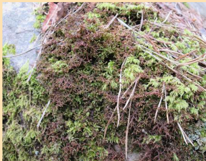
Une Hépatique ( Frullania tamarisci )