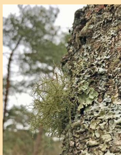
Un lichen aimant le brouillard ( Usnea sp)