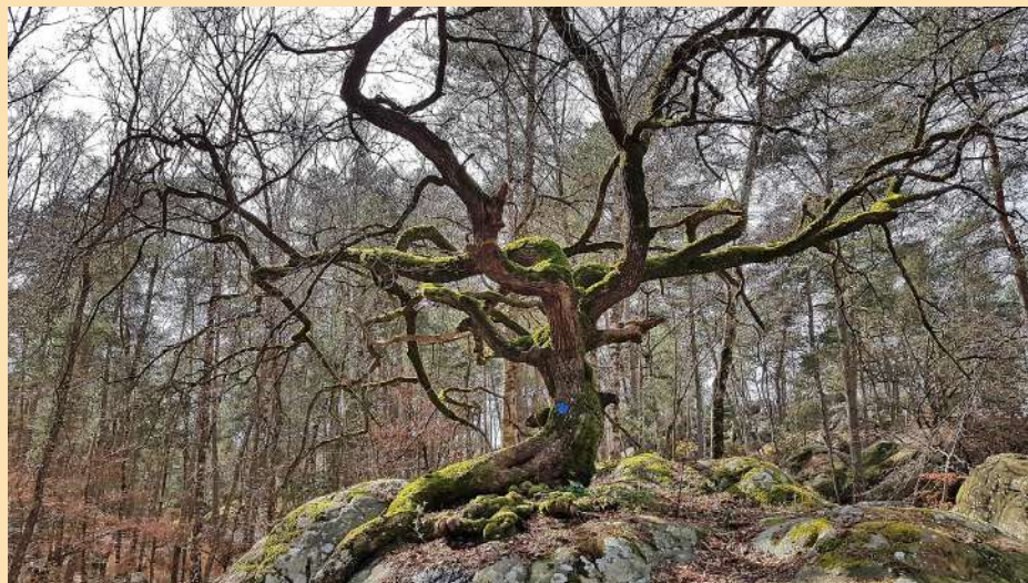
Le chêne bonsai du Rocher Canon