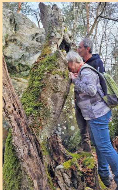
À la recherche