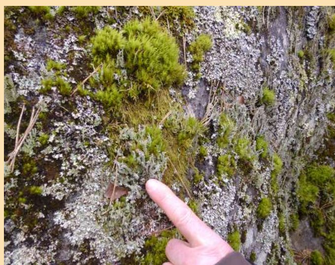
Un beau mélange de mousses et lichens