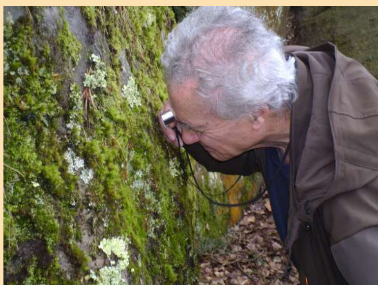
De l'utilité d'une loupe en promenade...