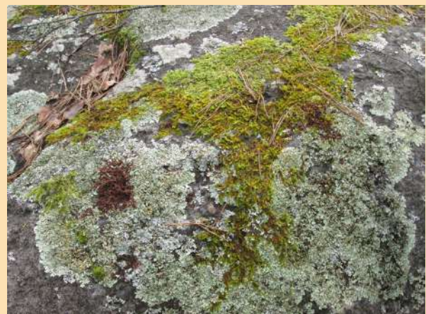
Combien d'espèces ?