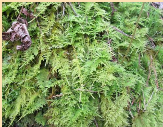
Une belle mousse des zones ombrées et humides ( Thuidium tamariscinum )