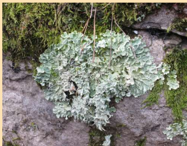
Un lichen commun en forêt ( Flavoparmelia caperata )