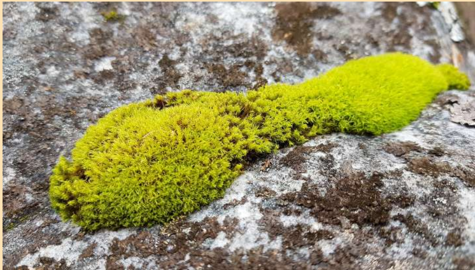
Un beau coussin de mousse ( Tortella squarrosa )