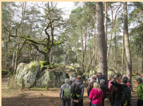
Devant le « Bonzaï » du Rocher Canon