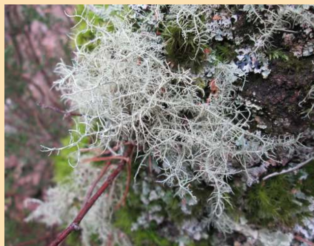
Un lichen du brouillard ( Usnea sp)