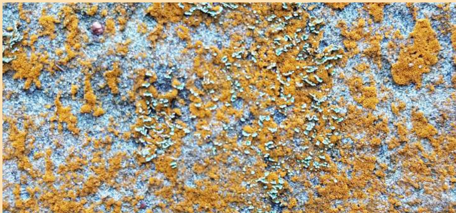
Une algue... verte! ( Trentepohlia sp)