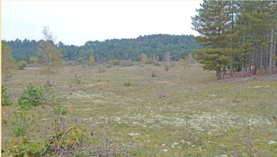
27 octobre 2024