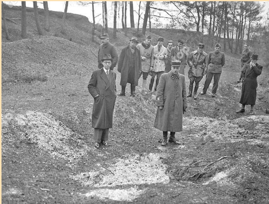
13 décembre 1944