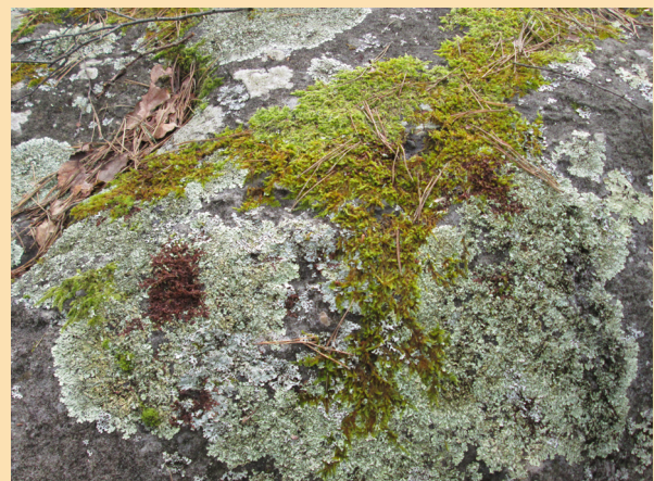
Combien d'espèces ?