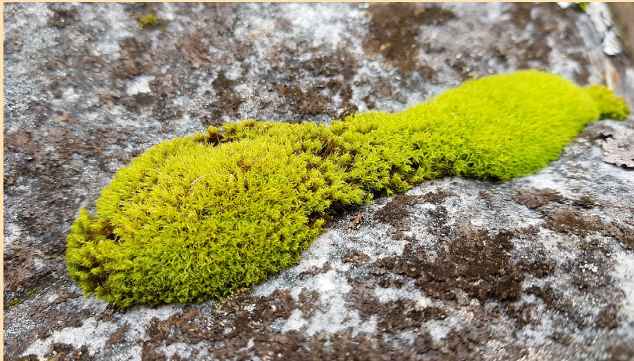
Un beau coussin de mousse ( Tortella squarrosa )