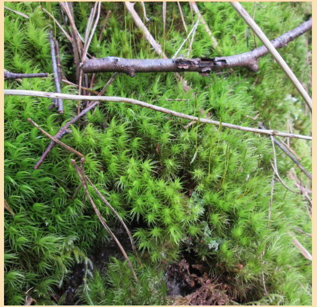
Une mousse en « coup de balai » ( Dicranum scoparium )