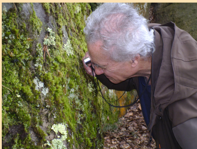
De l'utilité d'une loupe en promenade...