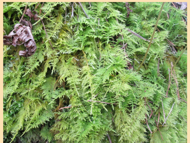
Une belle mousse des zones ombrées et humides ( Thuidium tamariscinum )