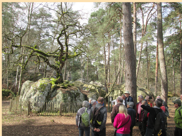
Devant le « Bonzaï » du Rocher Canon