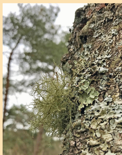
Un lichen aimant le brouillard ( Usnea sp)