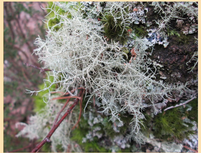
Un lichen du brouillard ( Usnea sp.)