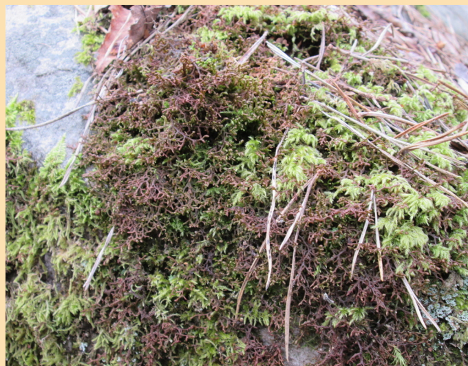
Une Hépatique ( Frullania tamarisci )