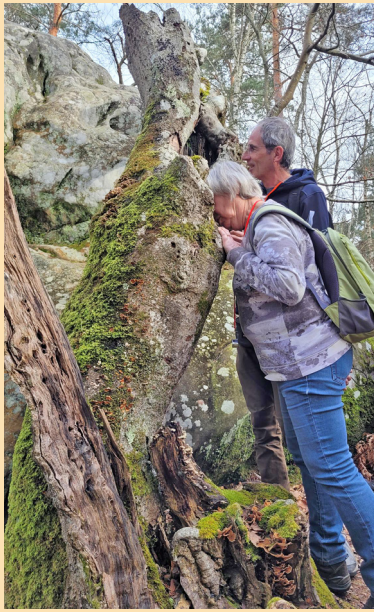
À la recherche