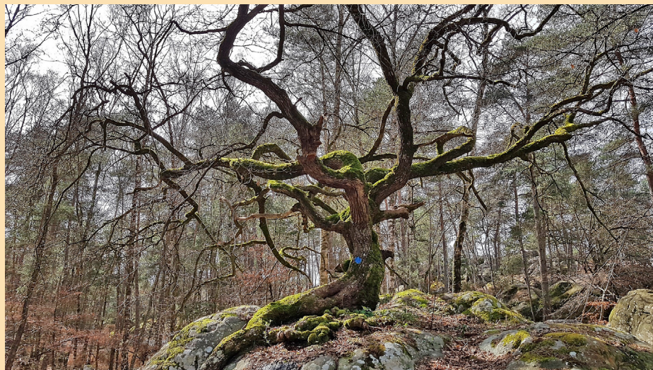
Le chêne bonsai du Rocher Canon