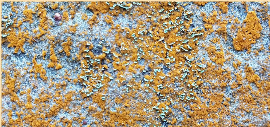
Une algue... verte! ( Trentepohlia sp)