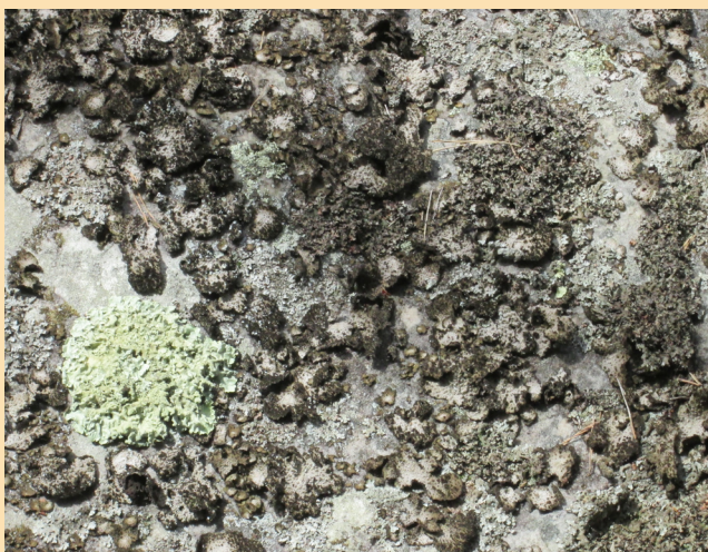
Un autre lichen qui aime le vent et le soleil ( Lasallia pustulata )