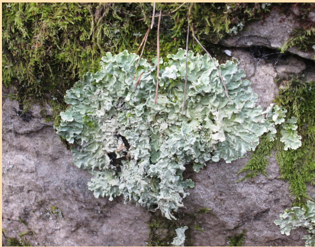
Un lichen commun en forêt ( Flavoparmelia caperata )