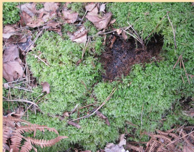
Une mousse « moquette » ( Isoetecium myosuroides )