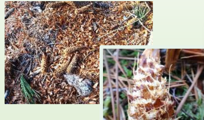
TABLE d'écureuil et CÔNE RONGÉ (Traces de repas)