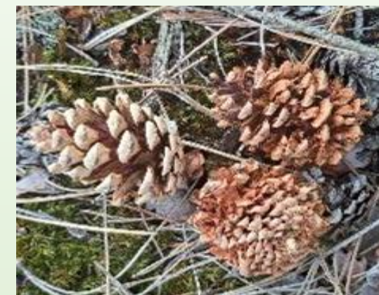
CÔNES DE PIN DÉCORTIQUÉS par le pic épeiche (Traces de repas)