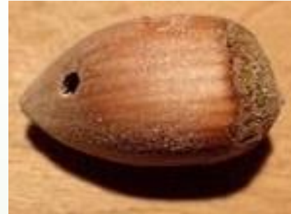
ORIFICE DE SORTIE dans une noisette percée par la larve de balanin