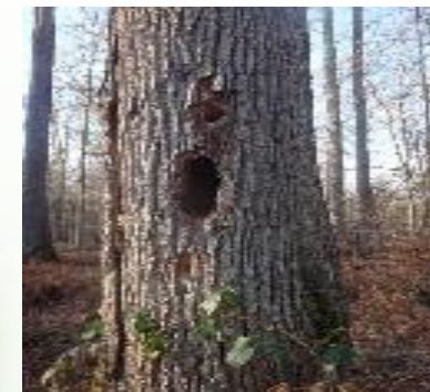
TROU de pic le long du tronc (Traces de repas)