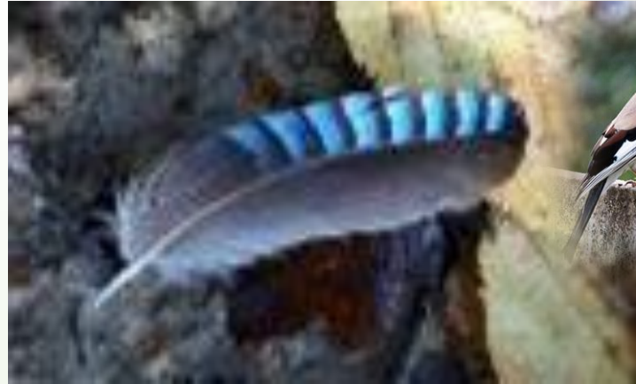
PLUME de geai trouvée au sol pendant la mue (Fin d'été)