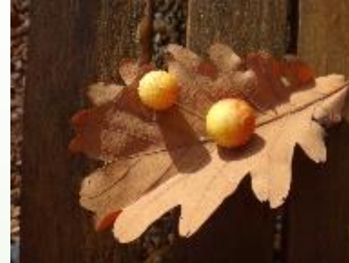
GALLE DE CHÊNE provoquée par une petite guêpe cynips