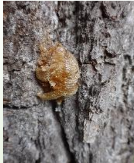
OOOTHÈQUE de mante religieuse (étui regroupant les œufs)