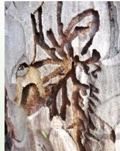
GALERIES de scolytes