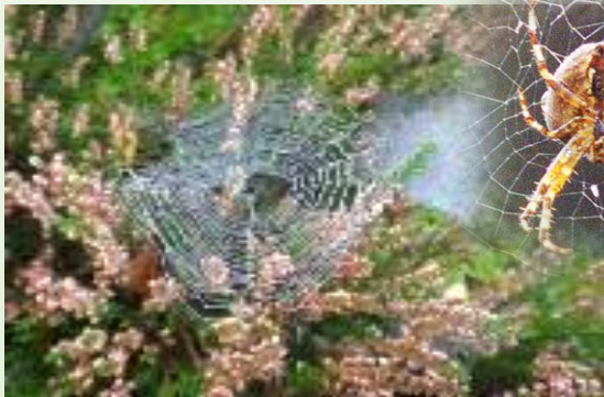
TOILE d'araignée, piège passif en soie