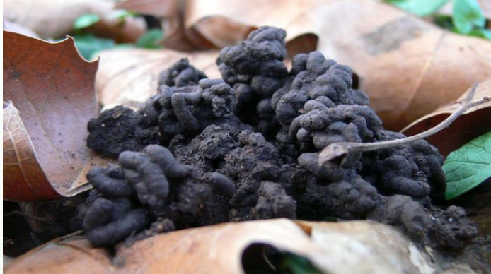
BOUDINS DE TERRE rejetés par un lombric : turricules (traces de repas)