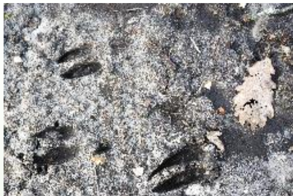
TRACES DE PAS de chevreuil (2 ongles)