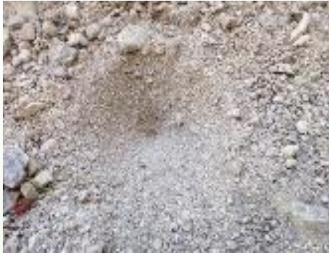
PIÈGE EN ENTONNOIR de la larve de fourmilion