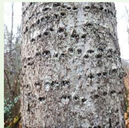
ALISIER PERFORÉ par le pic pour sa sève (Traces de repas)