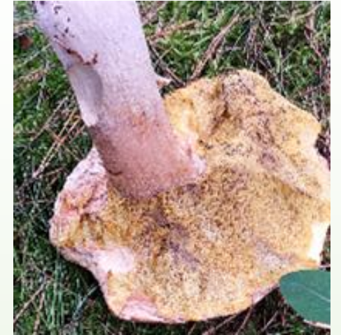
CHAMPIGNON GRIGNOTÉ par une limace (trace de repas)