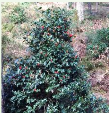
HOUX ABROUTI par un cervidé (Traces de repas)