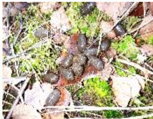
CROTTES de biche (Les fumées) *