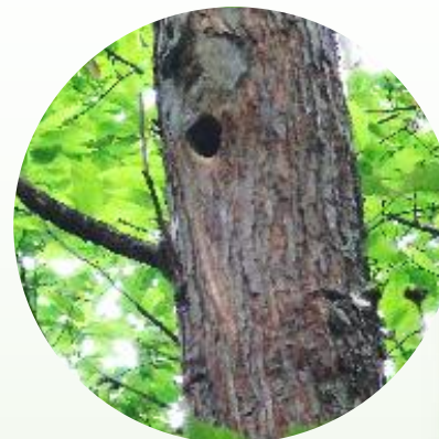
TROU de pic en hauteur, la loge ( nid )