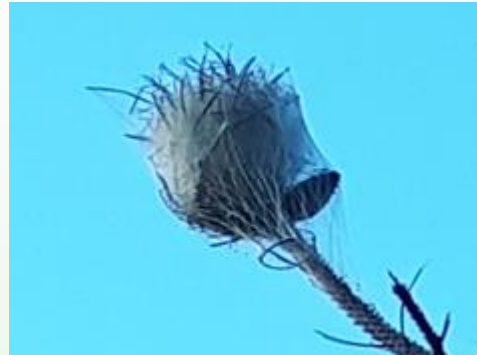
NID de chenilles processionnaires du pin Attention danger, ne pas approcher ni toucher.