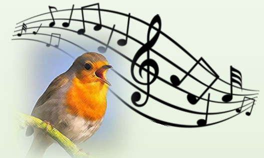
Les CHANTS ou les CRIS des oiseaux sont un indice de présence : marque de territoire ou cri d'alerte