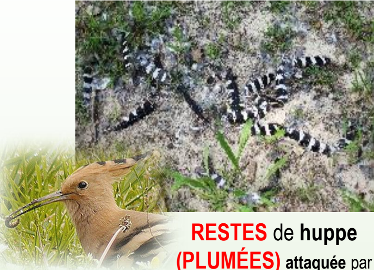
RESTES de huppe (PLUMÉES) attaquée par un prédateur