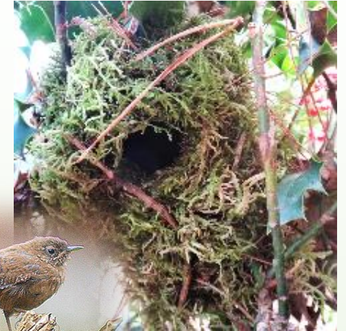
NID de troglodyte dans un houx