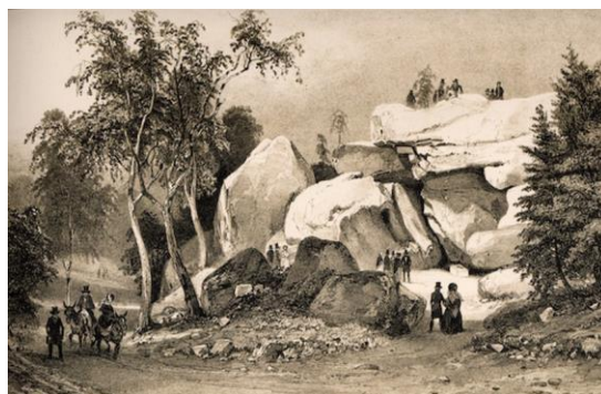
Un sentier tracé par Claude-François Denecourt en forêt de Fontainebleau au XIXe siècle