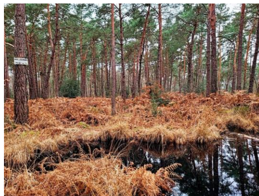
Pins sylvestre salamandre - AFF 2024

La forêt n'avait pas autrefois l'aspect que nous connaissons de nos jours, puisque les espaces boisés ne couvraient que la moitié de la forêt à la fin du XVIII e siècle. De ce fait, les forestiers ont voulu planter des arbres pour combler les landes qu'ils nommaient « vides » : des feuillus (chênes, hêtres.), puis à partir de 1815 des résineux ( pins sylvestres ), à grande échelle. En 1853, les landes n'occupaient plus que 4 % de la forêt.