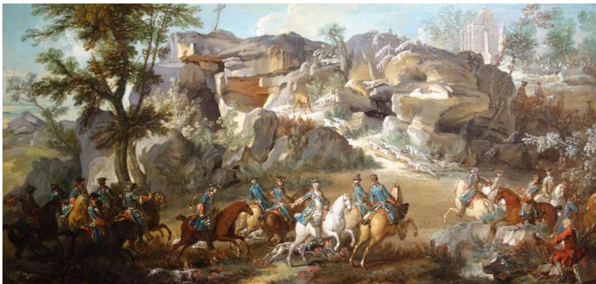
Jean-Baptiste Oudry (1686-1755). Le cerf qui tient aux chiens sur les rochers de Franchard, 1737. Huile sur toile. Paris, musée des Arts décoratifs.

Avec une superficie de près de 22000 hectares, le massif forestier de Fontainebleau est composé des forêts de Fontainebleau (17000 ha), des Trois pignons (3200 ha) et de La Commanderie (1400 ha).