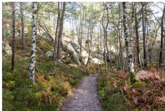
Sentier de randonnée en forêt de Fontainebleau

Il est primordial de sensibiliser les jeunes à la protection de leur environnement en ayant de bonnes pratiques lors des sorties familiales en forêt. La forêt enrichit leurs connaissances, tout en leur procurant du bien-être, mais ils doivent apprendre à devenir des éco-citoyens.