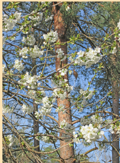
Merisier en fleur!