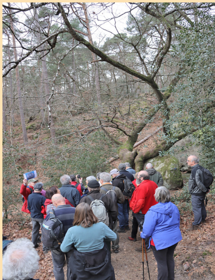
Le François I er