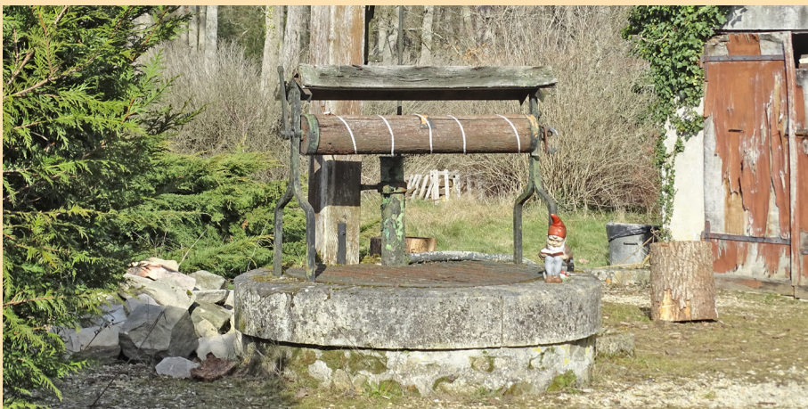
Retour aux Quatre-Routes, où nous étions attendus