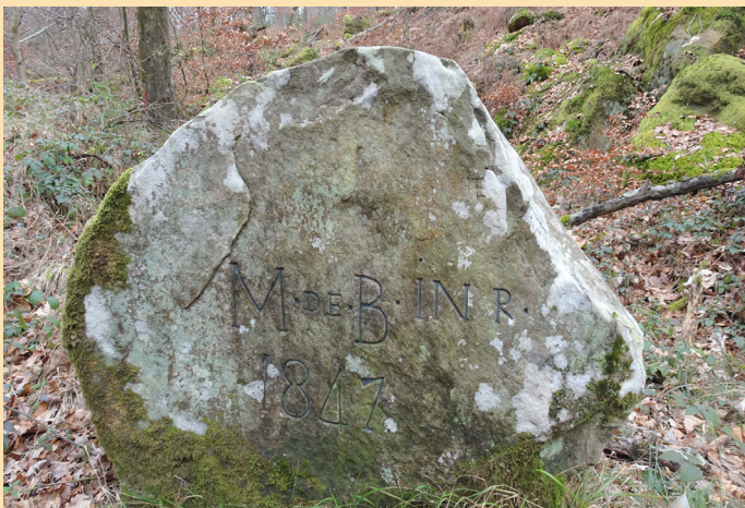
Inscription à Marrier de Bois d'Hyver, inspecteur du roi, 1847. Il a fait planter des pins sylvestres en grande quantité et a fait tracer des routes de promenade, comme celle de la Butte aux Aires.