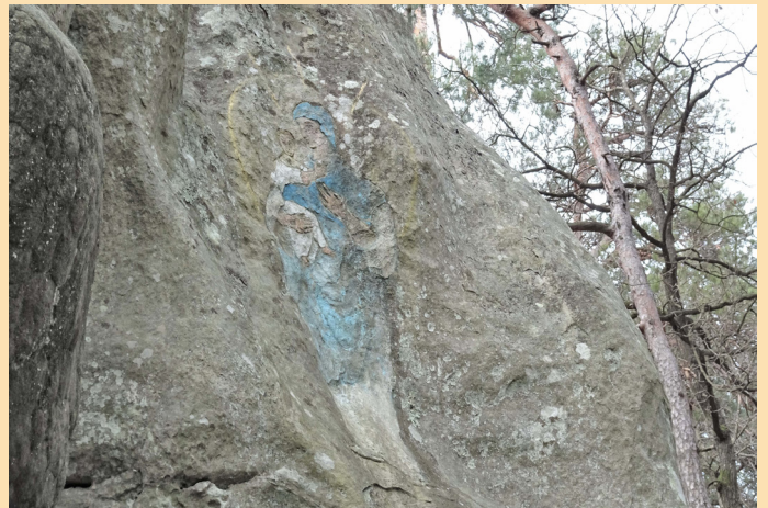
Vierge à l'Enfant du Rocher du Cid