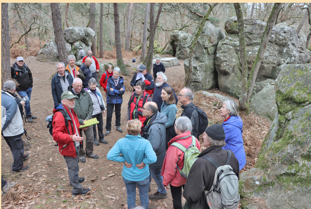
Chaos des Chimères, près de la Grotte des Montussiennes