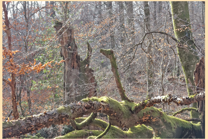
Chênes ruinés en Rbi