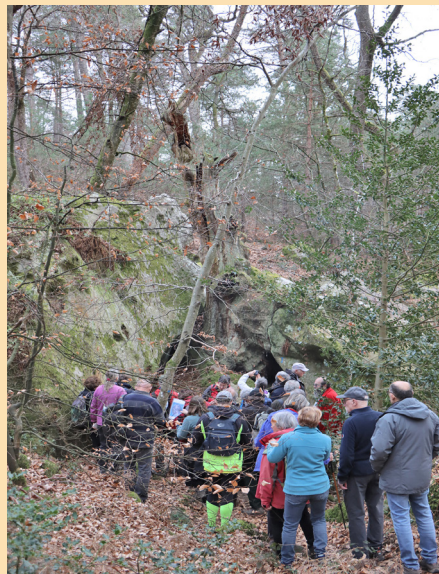
Chêne des Fées