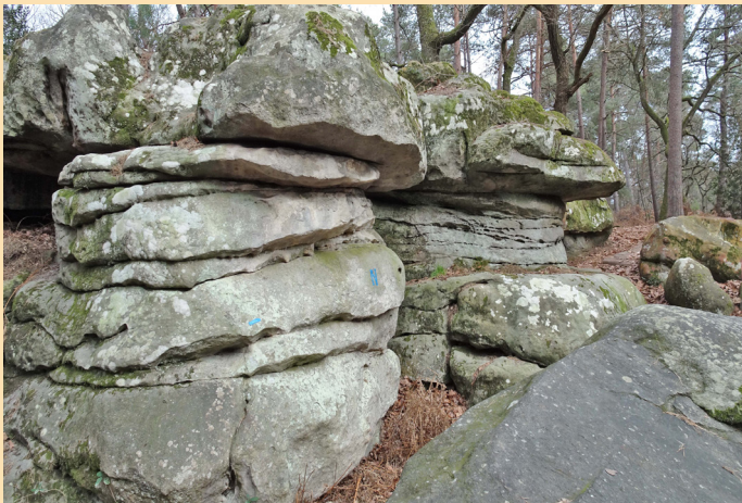
Le Chaos de Corneille d'après le Guide des promenades des AFF , mais le Chaos n'est pas là et ces rochers ont successivement été appelés le Double dolmen et les Deux Otmans. Que faire ? Réponse dans la prochaine édition du guide.