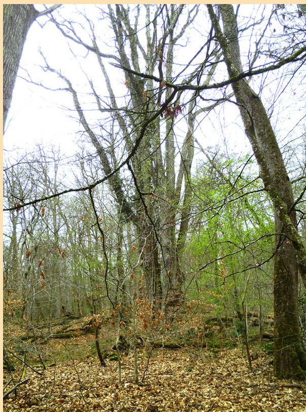
Le Feu d'artifice