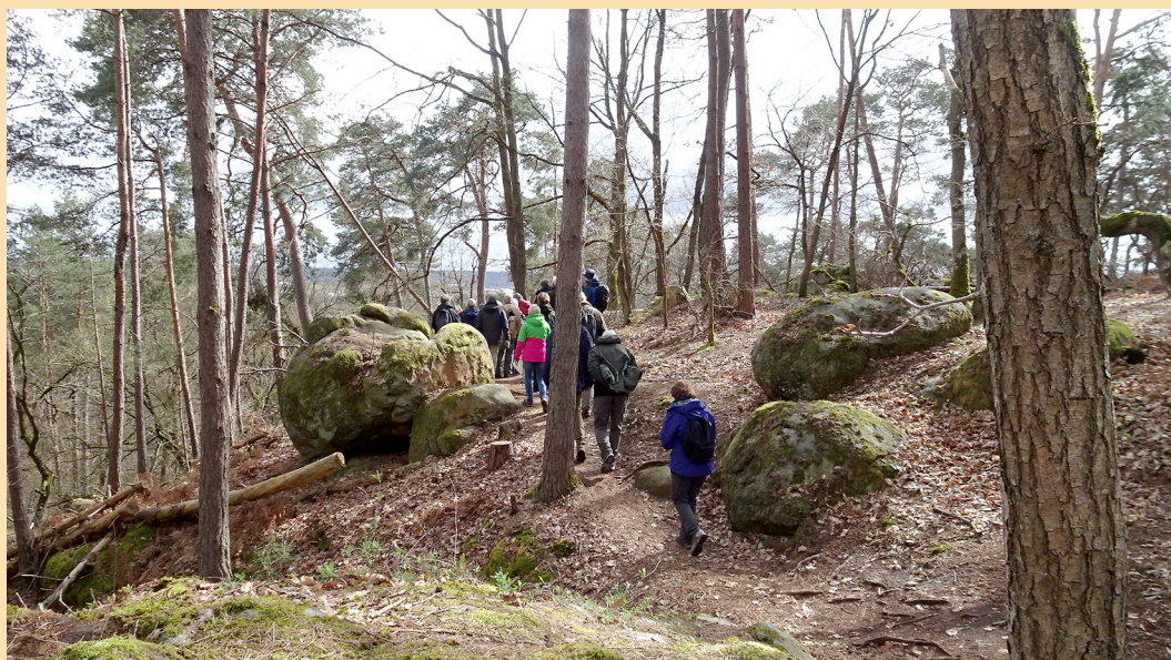
Le Sentier des AFF