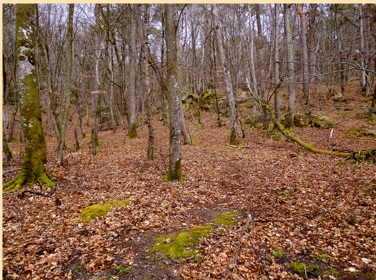
Le Sentier des artistes