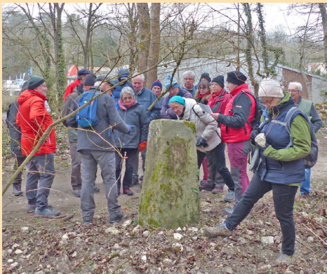
Borne de 1840 (limite est de la forêt)