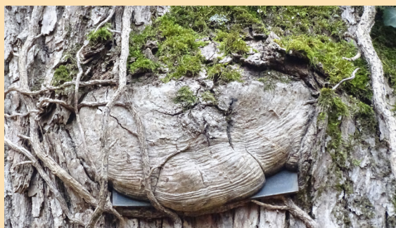
Des plaques « mangées » par les arbres