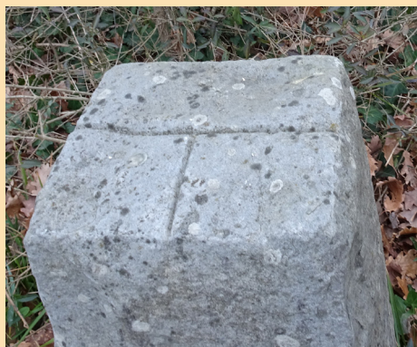
Fausse borne n° 1, datant des années 1990