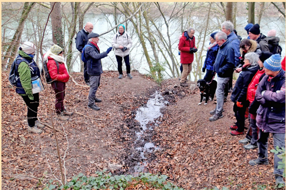
Source s'écoulant vers la Seine