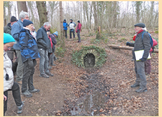
La fontaine Saint-Aubin d'après la carte IGN (la « vraie » est dans le terrain du château de la Rivière)