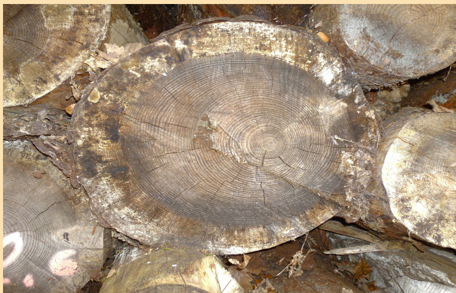
Des arbres coupés il y a deux ans sont toujours là