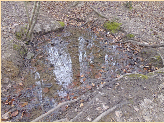
Source au contact des marnes