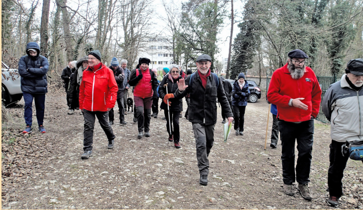
Depuis l'ancienne route de Bourgogne, prenons la Route de la Chaudière qui menait aux fours à chaux