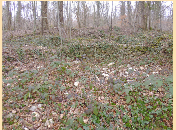
Page 30 de l'article de Jean-Claude, « Le Bois Gautier, deux mille ans d'histoire », la Voix de la forêt , décembre 2021, pp. 29-32 ; ruines du village gallo-romain du I er siècle ap. J.C.