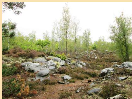
Route de la Fontaine-Sainte-Marguerite (PF 631)