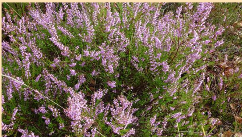
Question désormais traditionnelle : callune ou bruyère ? ou les deux ?

Après une légère descente, retour sur une voie sableuse et autres chemins pour accéder à ce qui fera le plaisir des photographes, les suites d'un incendie de juin 2020 . La platière au sud de la Vallée de la Gorge-aux-Archers, parcelle 619 , porte toujours les silhouettes des bouleaux calcinés sur un tapis végétal rougeoyant soutenu par les grès blanchis.