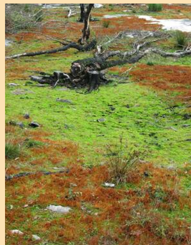
Mousse Funaria hygrometrica