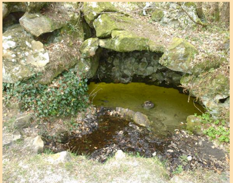
Ici non plus d'ailleurs (Fontaine du Touring Club, 1901)