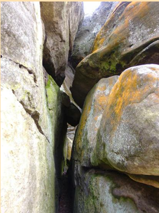
Antre « N'y entrez pas ! »