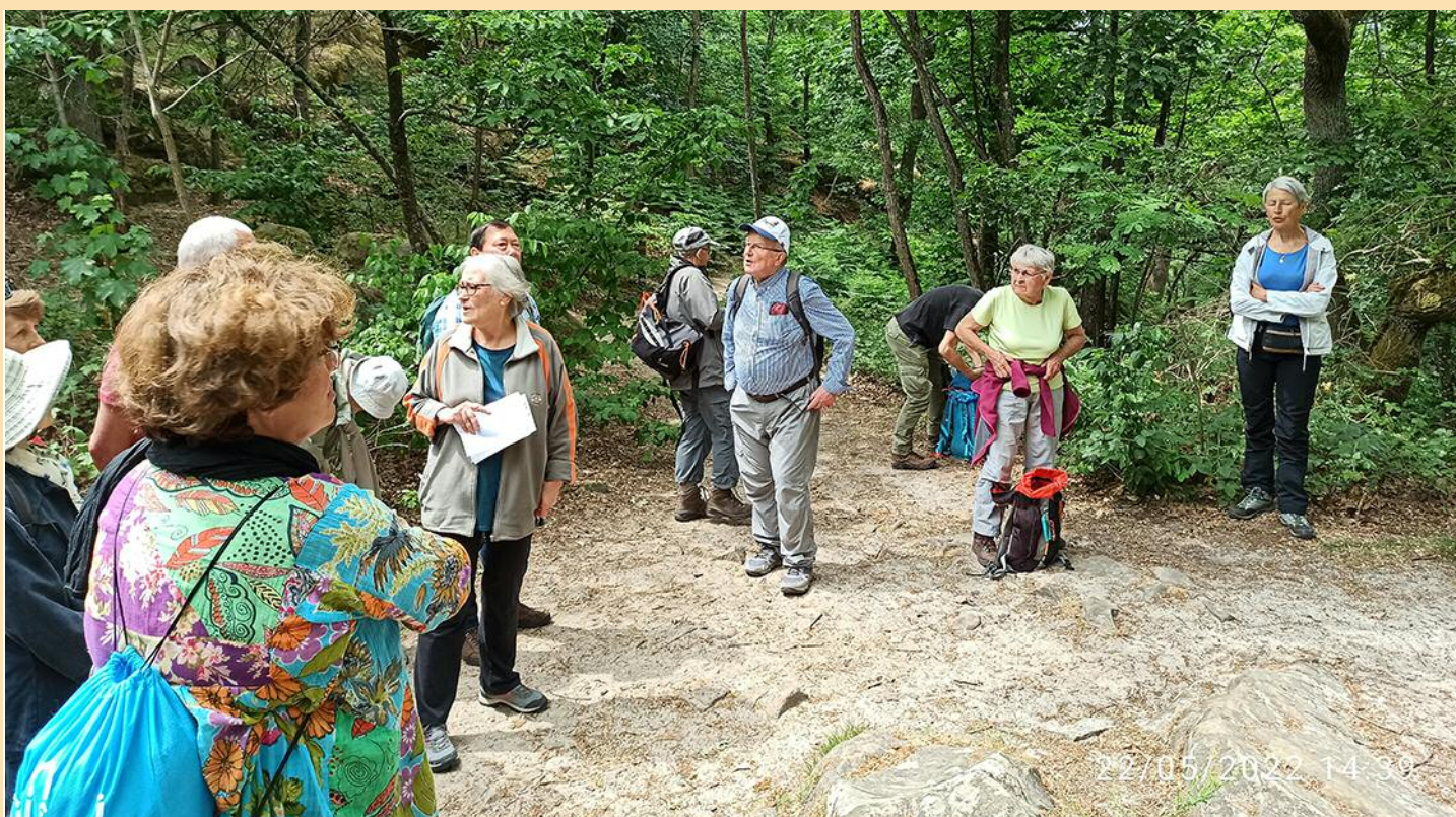
Où sont donc les retardataires ? Méditons...