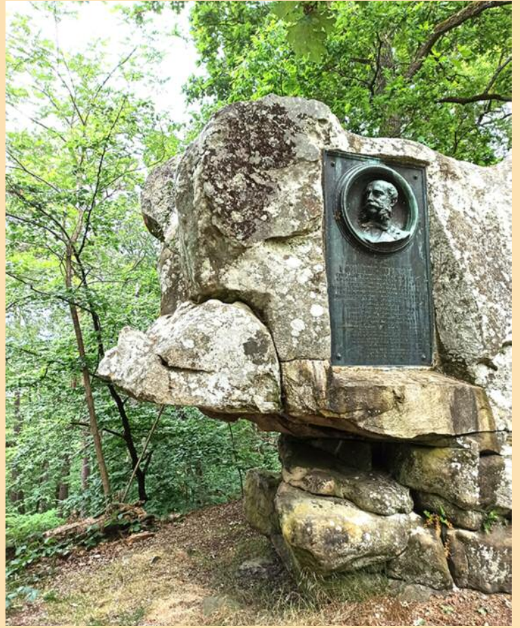
Sur la roche Tavernier, médaille (scellé en 1907) de Foucher de Careil