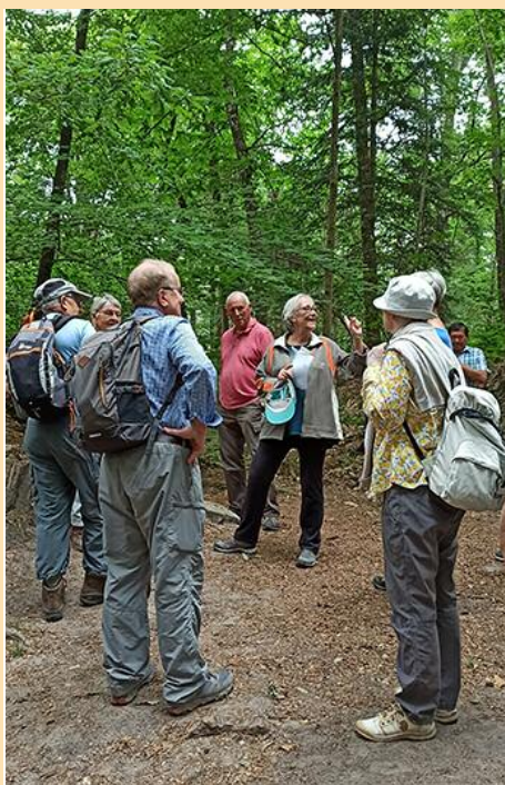
Commentaire, très écouté!