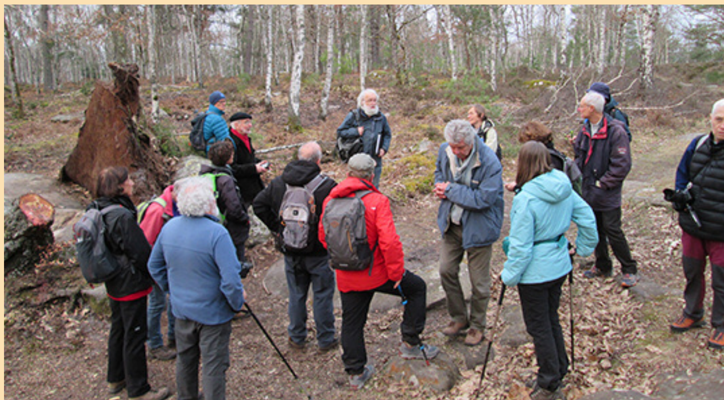
Près d'un étrange disque racinaire, il fallut se séparer, avant la nuit