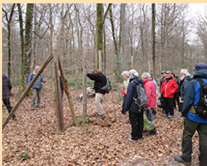
Route des Artistes : passage des artistes !