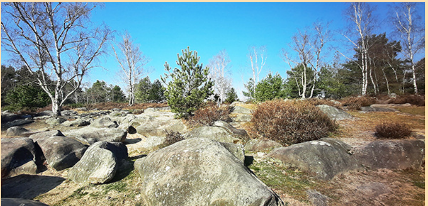
La platière d'Apremont

La promenade, parcourant toute une mosaïque de situations et de peuplements, a permis d'expliquer comment sont établis les objectifs de l'aménagement forestier, alliant réponse aux demandes sociétales, protection de la biodiversité et production de bois feuillus ou résineux, et son application programmée sous forme de coupes et de travaux.