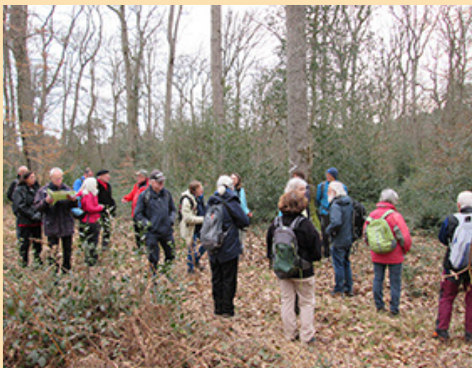
Limon et chênaie