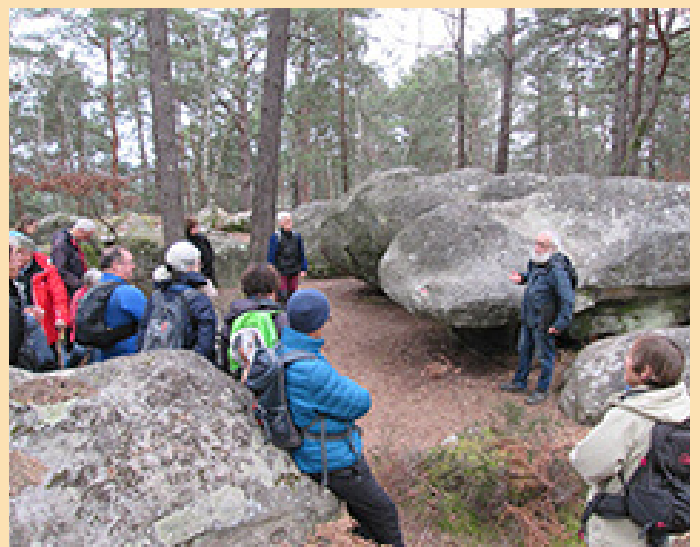
Sentier Bleu n° 6 (PF 719) : la recette des champignons