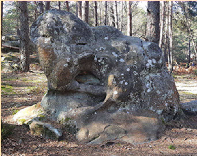
Altération post-glaciaire d'un bloc de grès à Apremont