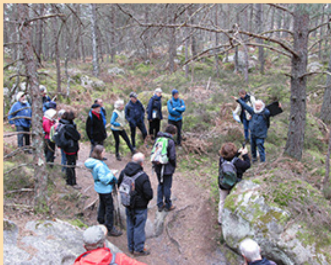
Sables, grès et sylviculture paysagère à Apremont