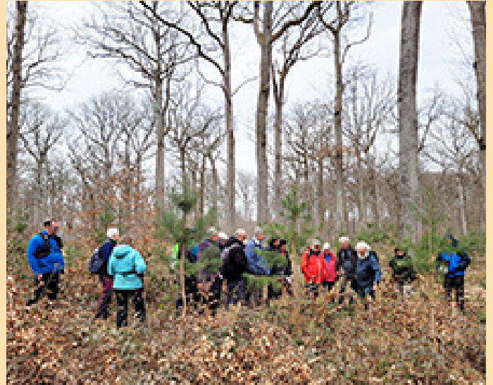
Le dosage des essences en régénération, tout un art ! (PF 708)