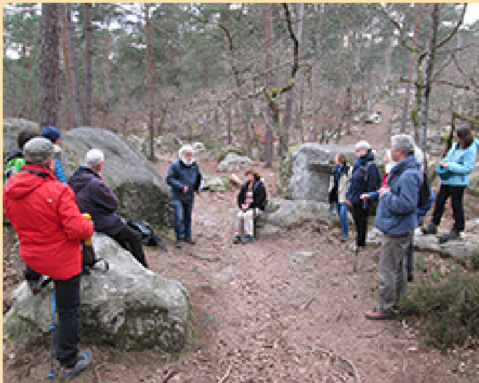
Route des Ventes Alexandre (PF 714) : la formation des grès