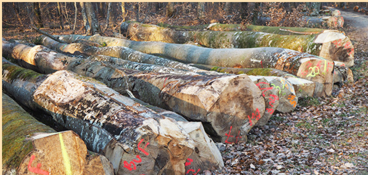
Grumes de hêtres issues d'une coupe sanitaire aux monts Girard