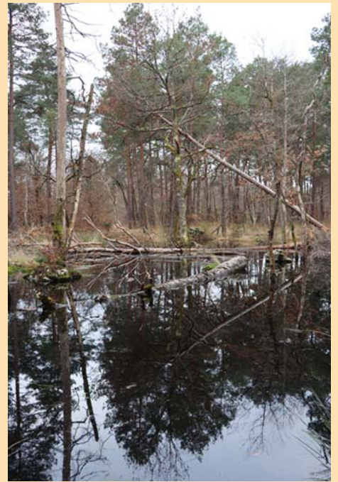
Mystérieuse mare récente, fausse mangrove