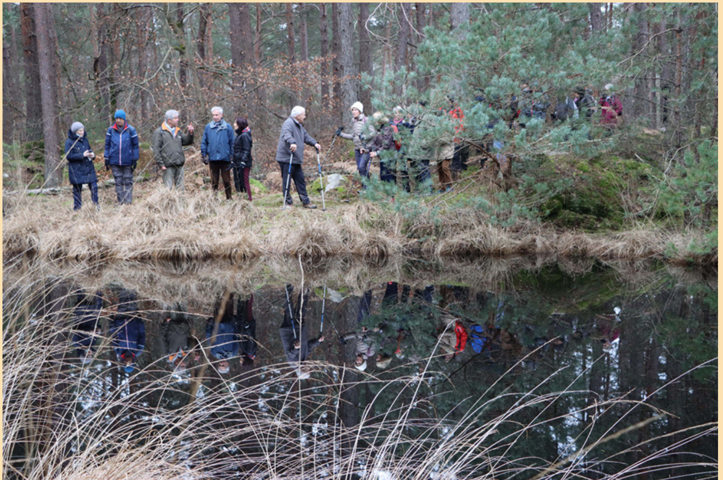
La mare Innominata