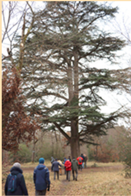
Cèdre de l'Atlas