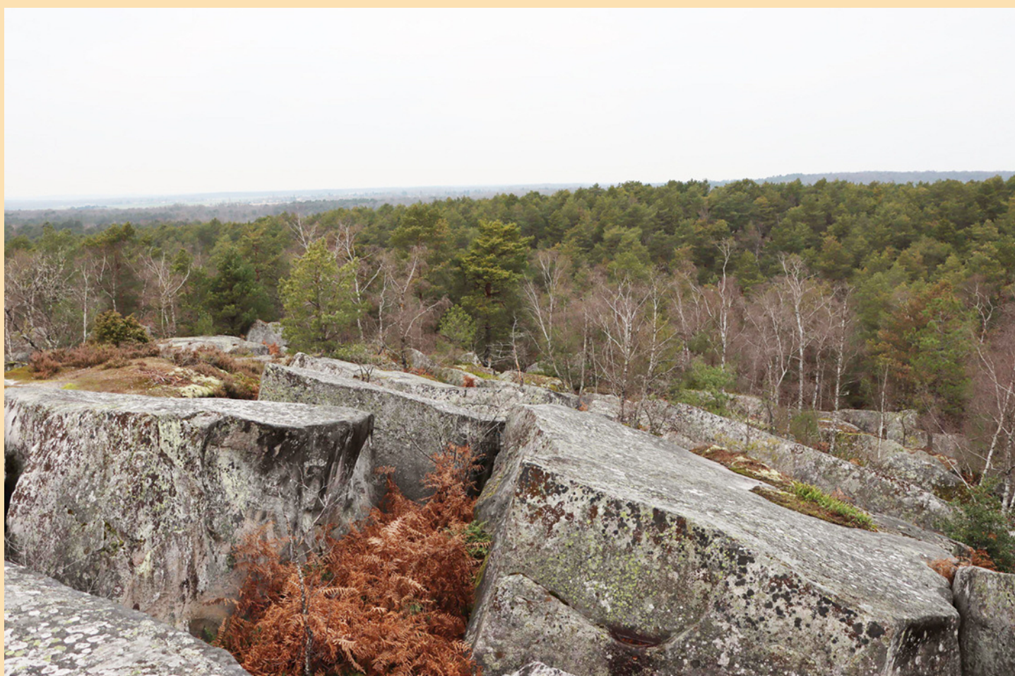
Point de vue des Hautes Plaines