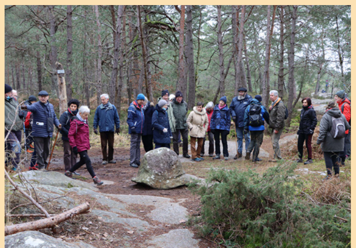
La Casquette du Jockey