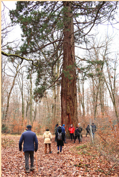
Séquoia géant de l'Arboretum