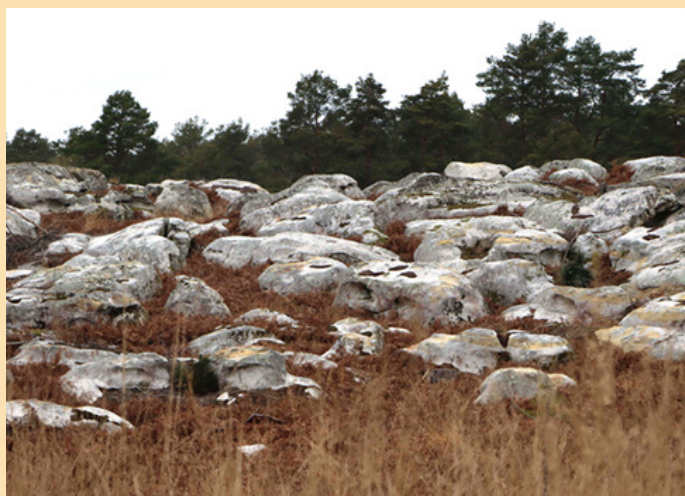
Rocher de Milly