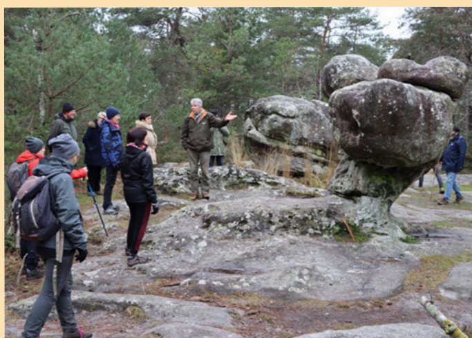
Le Sphinx des Druides