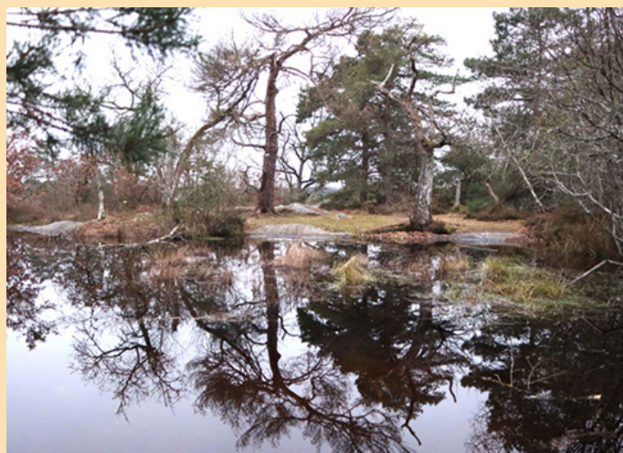
Mare de Franchard